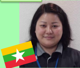
名前 ロイ ジャ