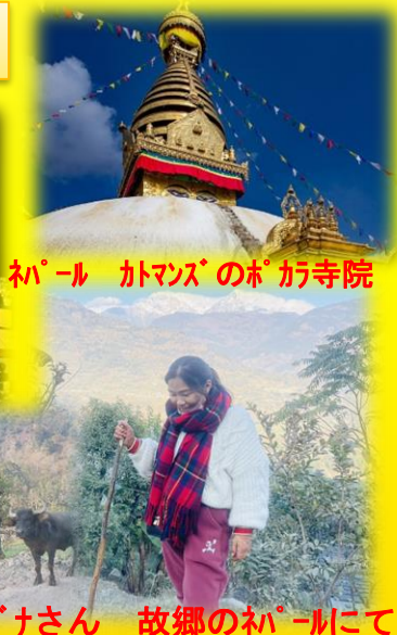
ネパール カトマンズのポカラ寺院