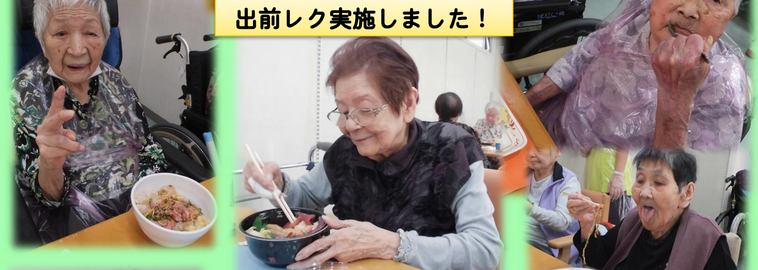
素敵な笑顔頂きました★