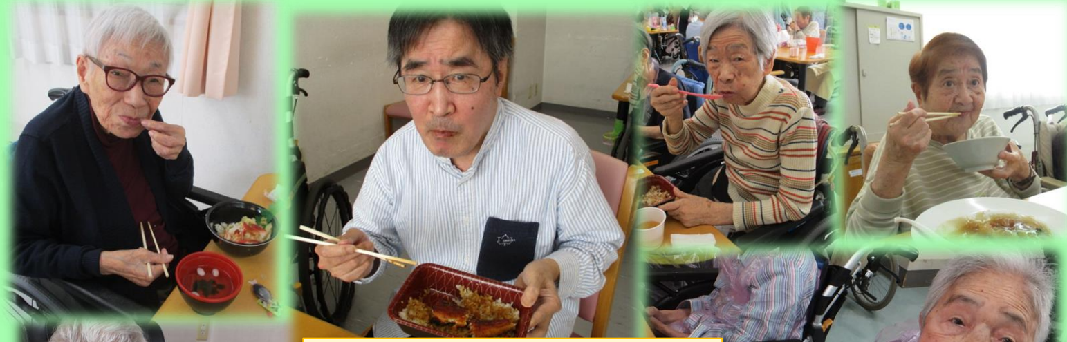
出前レク実施しました！