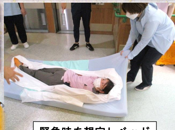
緊急時を想定しベッドのマットレスで避難

防災委員会の学習会に参加して、様々な気づきや発見がありました。普段から何気なく見ていた消火器や排煙口など非常時に使い方や場所が分からないと慌ててしまいます。それを防ぐためにも普段から意識しておく必要があります。