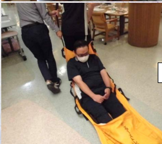
エアーストレッチャー

今回の学習会では、施設内の消火栓や消火器の場所を確認したり使用方法についても学びました。また、いつ何時発生しても対応できる様に学びを深めていきました。 今回、夜間帯に火災が発生したと想定しどのように利用者様を誘導するのかなど意見を出しながら実践をしました。