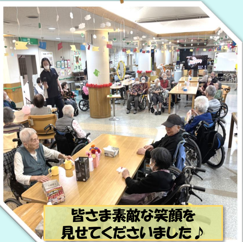
皆さま素敵な笑顔を見せてくださいました♪